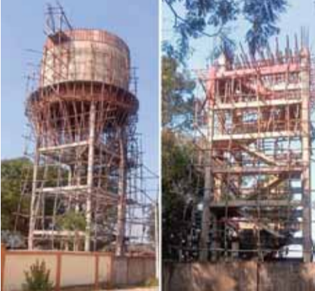
हरिभूमि न्यूज बदरा/जमुना।

नगर पालिका परिषद पसान में करोड़ों रुपये की लागत से संचालित शहरी नल-जल योजना अब नागरिकों के लिए राहत नहीं बल्कि अभिशाप बन चुकी है। सात वर्ष से अधिक समय बीत जाने के बाद भी योजना अधूरी पड़ी है। हालात यह हैं कि लोगों को पानी तो नहीं मिल रहा, लेकिन टूटी सड़कों, खुले गड्ढों और धूल-कीचड़ की समस्या जरूर झेलनी पड़ रही है। यह योजना प्रारंभ में सेंट्रल इंडिया इंजीनियरिंग, नागपुर को दी गई थी, जिसे आगे पेटी कांटेक्ट के रूप में अर्बन डेवलपमेंट कंपनी लिमिटेड, भोपाल को सौंप दिया गया। दोनों एजेंसियों की लापरवाही, अधिकारियों की उदासीनता और कथित मिलीभगत के कारण यह योजना अब भारी अव्यवस्था का शिकार हो गई है।