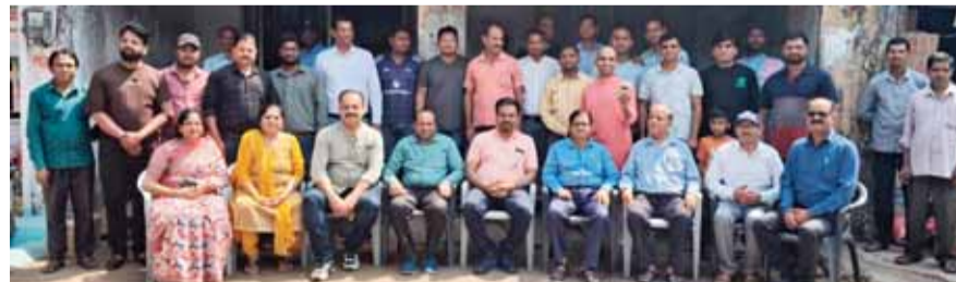
हरिभूमि न्यूज़ चवाई।

वर्ष 2026 में अमरकंटक ताप विद्युत गृह चवाई के विद्युत गृह में कार्यरत अधिकारियों कर्मचारियों एवं स्थानीय लोगों के लिए खुराखबन्दी यह रही कि विद्युत गृह के आवासीय परिसर स्थित एमपीईबी गैस सोसायटी, जिसका संचालन जुलाई 2024 से बंद था को नवीन संचालन समिति के पदाधिकारियों के लगभग 18 माह से भी अधिक समय के अनवरत प्रयासों के फलस्वरूप आखिरकार सफलता प्राप्त करते हुए, आज सुबह 11:00 बजे अमरकंटक ताप विद्युत गृह के प्रमुख कार्यपालक